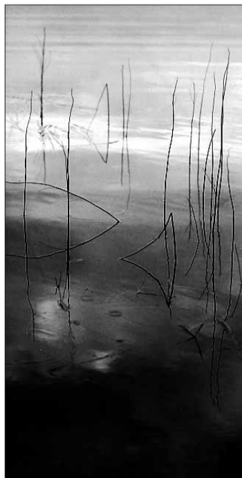
UNTITLED 4, 2001: Det tok meg 20 år å ta bildene i denne serien. De er inspirert av japansk kalligrafi, sier Siegert.