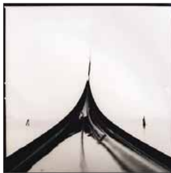
GONDOLA, 1996: Herdis Maria Siegert er mest kjent for fotografiene fra Venezia.