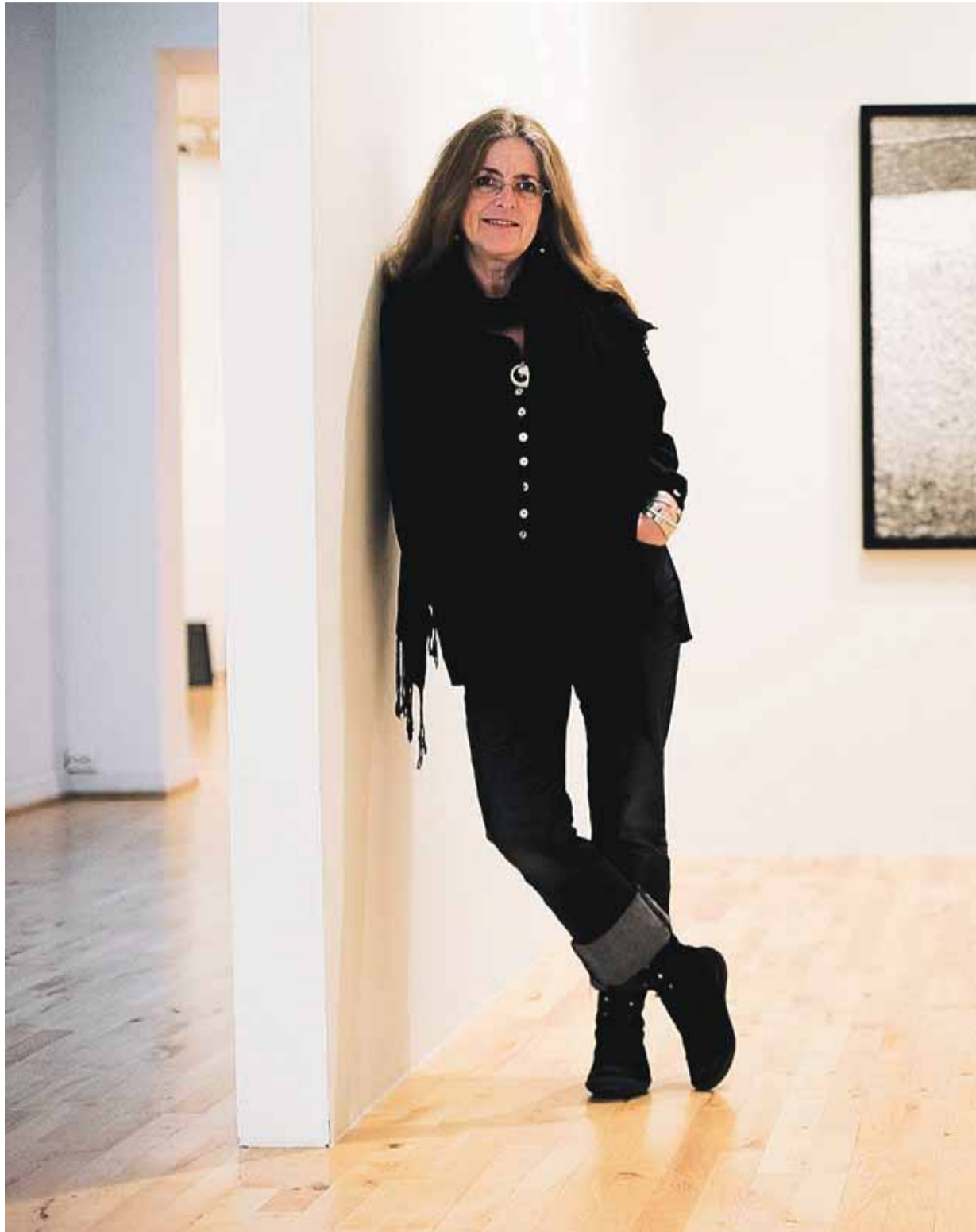
LUFTIG: – Haugar er et utfordrende lokale. Jeg har latt det være mye luft mellom bildene, sier fotograf Herdis Maria Siegert.

Siegert er først og fremst kjent for sine meditative landskapsbilder